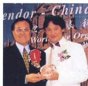
1999年12月18日於澳門舉辦WEO成立典禮之「濠情江輝慶回歸」慈善晚會部份籌委會委員。 18 December 1999 : Establishment of World Eye Organization during the "Macau's Splendor - China's Glory" Charity Gala.