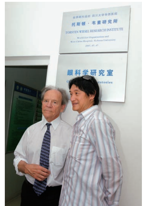
韋素教授與林文傑教授 Professor Torsten Wiesel with Professor Dominic Man-Kit Lam

在國際合作方面，與美國ALCON實驗室，澳大利亞蒙納士大學及哈佛大學等諸多世界頂級院府進行人才交流及科研項目合作。