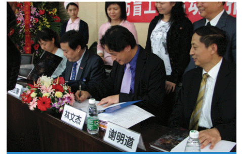
開幕典禮 Opening Ceremony

世界眼科組織華西醫院李兆基博士眼科中心將秉承“看見就是幸福”的信念，讓更多的人，特別是革命老區、邊緣地區、少數民族地區的農村貧困人口、孤老或孤兒、“三無”人員、城市中低保收入或下崗工人、殘疾人員或複員軍人無社保者、綜合殘疾人員、省級以上勞模、特級教師、軍屬或複員退伍軍人等中的白內障患者得到治療、早日重見光明。